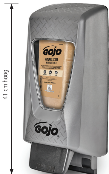
GOJO PRO TDX Dispenser • 2000mL Grijs: 7200-01-EEC00DG