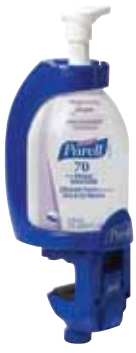
5704-06-BLU with 5795-04-CAN00