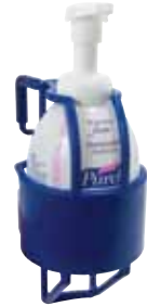
5701-12 with 5795-04-CAN00