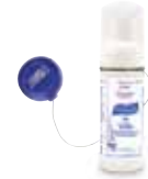
9608-24 with 5695-24-CAN00