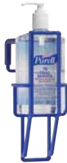
9007-12 with 9770-12-CAN00