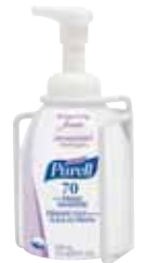
5700-06 with 5795-04-CAN00