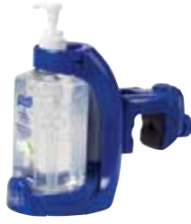
5704-06-BLU with 3770-12-CAN00